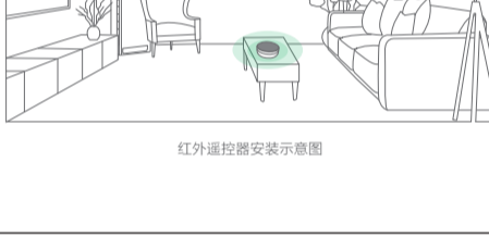
红外遥控器安装示意图